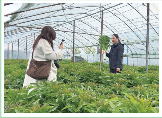
助农团队拍摄小香笋宣传视频。