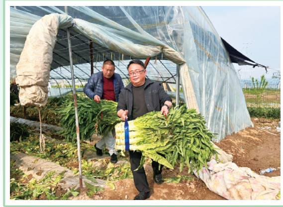
助农团队帮忙运送小香笋。