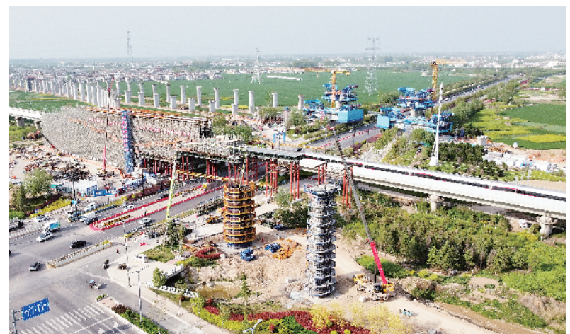
4月9日，记者在平深周高铁跨太清路桥建设现场看到，机械运转，塔吊高耸，工人正在浇筑大型桥梁结构，一派热火朝天的施工景象。

“十五五”刚刚开局起步，在新的起点上树好树牢政绩、推动周口发展，需要一步一个脚印实干。农业强市建设不会一蹴而就，通道经济崛起需要久久为功，城乡面貌改善更非一日之功。唯有弘扬“严严实实”作风，树立“实干比”的导向，展现“功成必定有我”的担当，才能把政绩真正干在三川大地、写进人民心中。②19