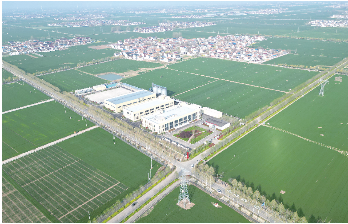
俯瞰周口国家农高区麦田。

种子是农业的“芯片”，更是守护国家粮食安全的命脉。周口国家农高区因筑牢粮食安全根基而生，因推动小麦产业升级而兴。自获批设立以来，农高区始终紧扣国家粮食安全战略，把科技创新作为小麦全产业链提质增效的核心引擎，不断书写传统农业向现代农业转型的新篇章。